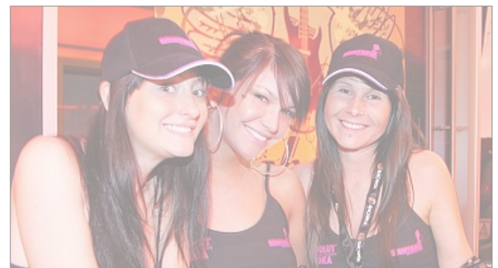
Kesse Girls dürfen nie fehlen...

Schon nach den ersten Wochen steht fest, wo in Zukunft in Salzburg die Musik spielt. Beim Start war das „who is who“ des Landes von diesem einzigartigen Erlebnistempel begeistert. Bei der Eröffnung