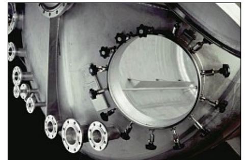
Tanks gibt es für alle Branchen und in variablen Größen.