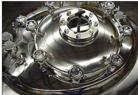
Know-how ist beim Tankbau entscheidend.

Hinke Tankbau GmbH Frankenburger Straße 2 4870 Vöcklamarkt E-Mail: office@hinke.com http://www.hinke.com