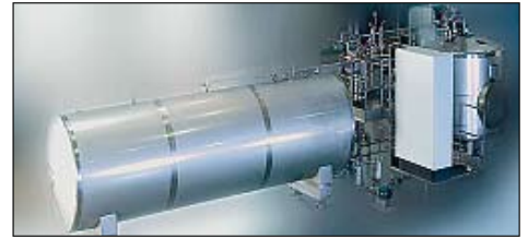
Tanks von Hinke sind weltweit gefragt.

So wurde zum Beispiel eine Greenfield-Brauerei in Sevilla/ Spanien mit 35 Tanks und Behältern mit einem Volumen von 500 bis 300000 Liter ausgestattet. Der Transport der zum Teil sehr großen Behälter (bis 4 m Durchmesser) erforderte neben der exakten Pla-