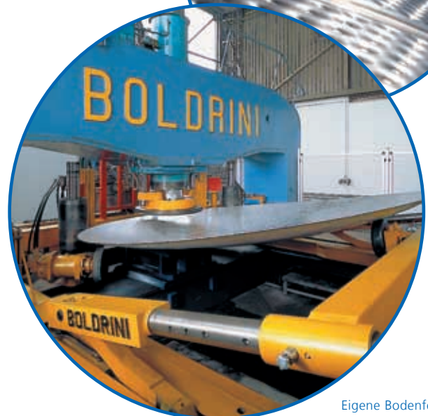
Eigene Bodenfertigung bis 4 m Durchmesser