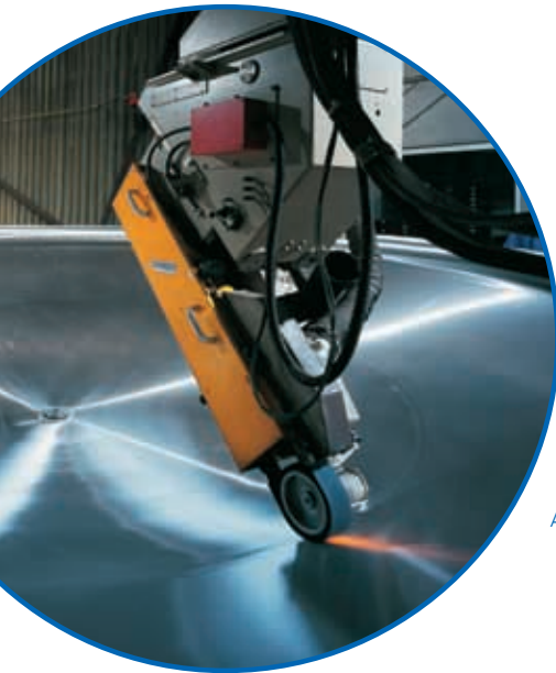
Automatische Konen- und Bodenschleifmaschine für Innen- und Außenschliff bis Ra 0,5 \mu m